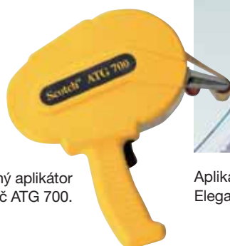
Jedinečný aplikátor – odvíječ ATG 700.