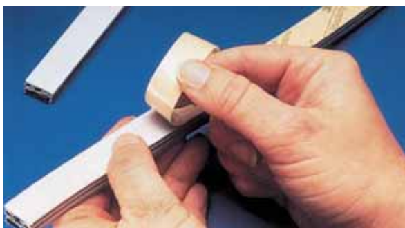
Laminování na díly pomocí velmi účinné oboustranné lepicí pásky.

Pokud vyrábíte produkty či polotovary, které jsou určeny k tomu, aby měly samolepicí vlastnosti, jako je tomu v případě některých typů těsnění, ozdobných částí nábytku, vytlačovaných plastů nebo též propagačních materiálů, pak Vám mohou oboustranné pásky od společnosti 3M poskytnout rychlé a účinné prostředky pro dosažení trvanlivého spoje. Nanesete pásku na daný produkt a na její horní straně ponecháte krycí vrstvu /liner/ až do okamžiku, kdy chcete předmět někam nalepit.