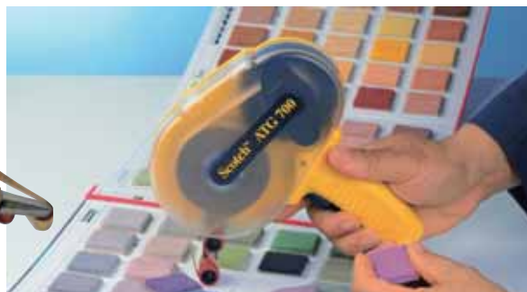
Aplikace pásek ATG pomocí aplikátoru ATG 700. Elegantně a rychle lze zhotovit vzorníky rozličných materiálů.

ATG systém firmy 3M představuje neekonomičtější a nejjednodušší aplikaci lepicí vrstvy pro účely upevňování či permanentního připevnění. Podstatou systému je mechanický odvíječ ATG 700, který nanáší tenkou oboustrannou pásku (v podstatě proužek velmi přilnavého transparentního lepidla). Systém je ideální pro lepení či připevňování plakátů, nabídkových tabulí a reklamních panelů, fotografií, oznámení, desek na dokumenty, obrázků a letáků. Díky ATG systému lze podstatně urychlit celý výrobní proces, zejména při vytváření vzorníků (viz obrázek), výrobě koláží a různých šablon. Odpadají zde doprovodné jevy provázející klasické lepení tekutými lepidly – zbytky lepidel, přetoky, kapky a znečištění okolí. Aplikace je přesná a ekologická, nehromadí se nepořádek a prázdné obaly.