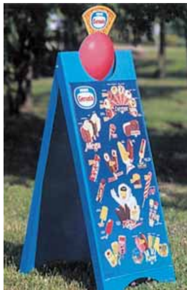
Pásky ATG a oboustranné pásky firmy 3M jsou ideální k lepení reklamních panelů.

Protože lze lepidlo nanášet ve stejnoměrné tloušťce přesně tam, kde je to právě třeba a bez odpadů, mohou být oboustranné pásky 3M a lepicí transferové pásky používány s absolutní důvěrou na reklamních panelech v aranžérství, dále při různých vnitřních úpravách, při upevňování panelů, rámování obrazů, při označování a při montážích elektroniky.