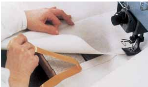
Oboustranná lepicí páska 3M přidržuje plachtovinu před jejím sešítím.

Oboustranné lepicí pásky 3M jsou ideální ke spojování materiálů před jejich sešíváním. Jedinečné složení lepidel 3M pásek odstranilo ulpívání lepidla na jehle a tím odpadly i nákladné prostoje při čištění strojů a nebezpečí poškozování zpracovávaných tkanin a materiálů. Typickými příklady použití jsou výroba plachet, upevňování tkaninových odznaků, praporů nebo transparentů a výroba propagačních oděvů.