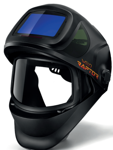
Przyłbica spawalnicza MOST WELD RAPTOR black Nr katalogowy - 72 00 912010