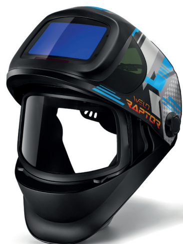
Przyłbica spawalnicza MOST WELD RAPTOR techno blue Nr katalogowy - 72 00 912020