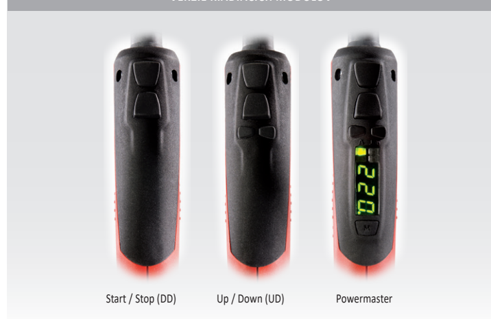
Start / Stop (DD)